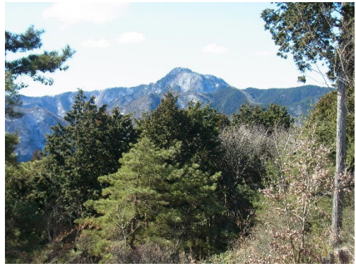
二百名山の大岳山(1266.5m)

ここから金比羅尾根を下り、麻生山(794m)を通過して、1時間半ほどよい道を下っていくと金比羅山(648m)、琴平神社にでる。ここから五日市の町がきれいにみえた。