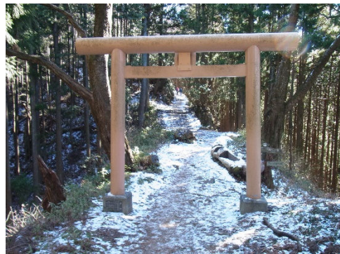
雪が結構残っていた

日陰や木陰は3cmくらい積雪がある。湿気の少ない雪である。分岐点がいくつかあり間違えないようにくだる。ほとんど起伏を感じないままに日の出山(902m)についた。展望がすばらしい。高齢者のグループの人たちが30名、若者が10人くらい昼食の時間で皆さん楽しそうである。