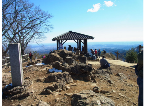
日の出山からの展望