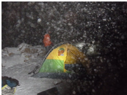
小屋近くのテント場

テントを何張りも晴れる場所は無かったが、小屋の近くに良い場所があった。小雪の中テントを張っていると暗くなった。夕食はとんかつである。生卵を3個持ってきていてびっくりした。