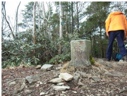
三等三角点の頂上

やはり奥秩父主脈の縦走ならこの県界稜線を通らなければやったとはいえない。ここから、ゆるやかに2ピッチ半ほど緩やかに下って行くと、将監峠の手前で広場に出て、笠取小屋からの巻き道と合流したのちに、落合からの登山道にも合流する。将堅小屋はここからすぐである。