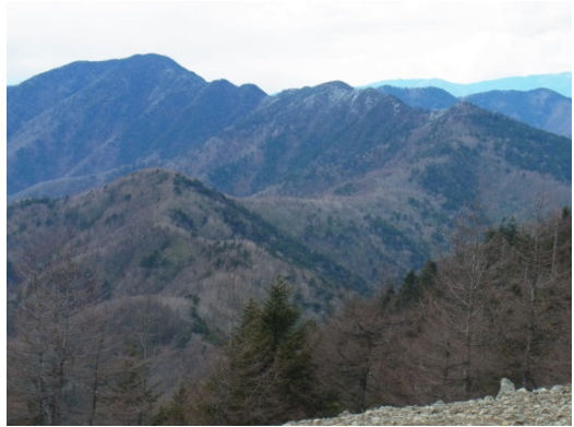
振り返ると登山道の稜線