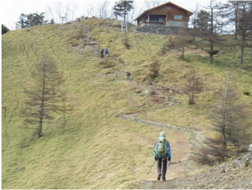
頂上直下の雲取山避難小屋