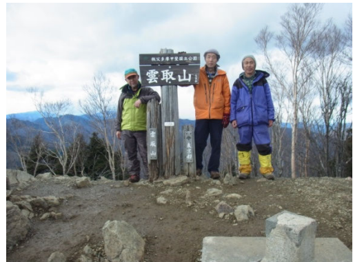
大三角点(明治15年測量)の前で

下山は当初の計画を変更して、七ツ石山(1757m)経由鴨沢へ下ることにした。なだらかなよく整備された登山道を下って行くと、奥多摩小屋あたりから登山者に会うようになる。登山道は広く、気持ちよく歩ける。ヘリポートを過ぎ、七ツ石山の手前のブナ坂の手前で右に折れる巻き道があり、疲れた体にはきついブナ坂を登らずにすみホツとする。しかしここからが長い。登りの時は、それほど長いと思えないのに、下山の時は、疲れと早く下山したい気持ちがあるから長く感じるのだろう。途中でキャップライトを出して下った。車道に出た時はうれしかった。近道はこれを通り切っていくのだが、車道通しに降りて行く。車は一台も通らない。暗くて時間がかかり鴨沢はどんな町なのか不安になる。何とか家が見えた時はうれしかった。鴨沢からの最終バスは出てしまったが、食堂のご主人にもう一つのバス停を教えてもらい無事に20時の最終バスにのれた。電車の中でビールと酒を飲んでうちあげた。