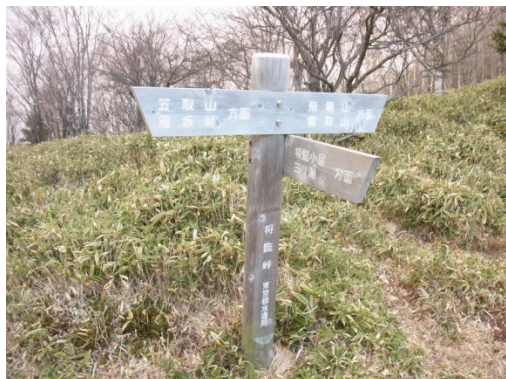
笠取山・雲取山・将堅小屋の分岐

やはり奥秩父主脈の縦走ならこの県界稜線を通らなければやったとはいえない。ここから、ゆるやかに2ピッチ半ほど緩やかに下って行くと、将監峠の手前で広場に出て、笠取小屋からの巻き道と合流したのちに、落合からの登山道にも合流する。将堅小屋はここからすぐである。