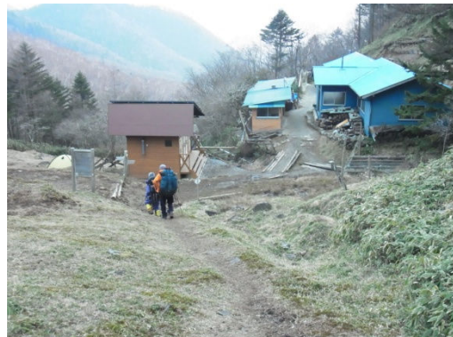
将堅小屋(左がトイレ)(中間が避難小屋)