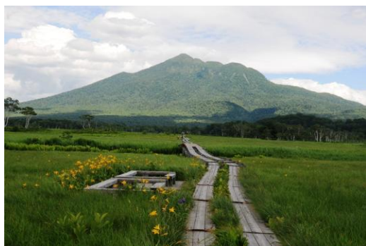
尾瀬ヶ原のニッコウキスゲ

鳩待峠 10:10—11:01 山の鼻(昼食) 11:55—12:35 牛首分岐 12:50—13:30 竜宮小屋—13:50 見晴(弥四郎小屋泊)