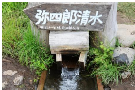
弥四郎小屋前の湧き水