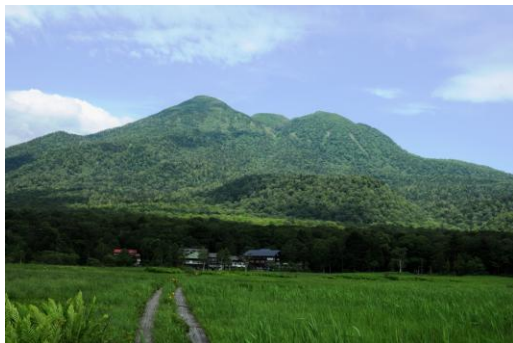
見晴の山小屋が見えて来た