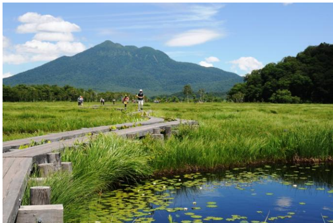
燧ヶ岳を正面に尾瀬ヶ原をのんびり歩く