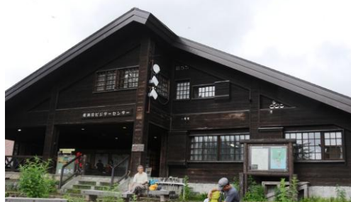
尾瀬沼ビジターセンター

尾瀬沼ビジターセンターに立ち寄り、長蔵小屋付近で三平峠方面の道を見失い、時間をロスする。三平峠下の尾瀬沼山荘を右