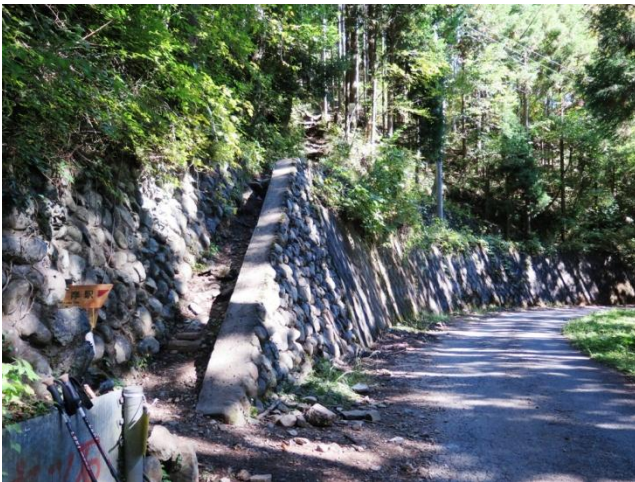
登山口の林道に出た

捲き道は、標識はあるが目印となる場所の表示が無いので、どの辺りを歩いているのか分かり難い。単独で奥多摩駅から登って来たと言う別の女性に時間を聞いてみたら、奥多摩駅を8時に出たと言う。時計を見ると10時を少し回ったところだ。どうやら12時前に奥多摩駅に着きそうだと分る。六ツ石山の山腹を歩いている時、突然ガサガサという音がしたので熊かと身構えたら、猿の一群が斜面を一目散に駆け下りて行く。少し行くともう一群が斜面を駆け下りて行った。鈴を鳴らして歩いていたので反応した様だ。脅かされた。杉・檜林を下って行くと登山口の林道に出た。長い縦走路だったが石尾根を下って来て良かった。