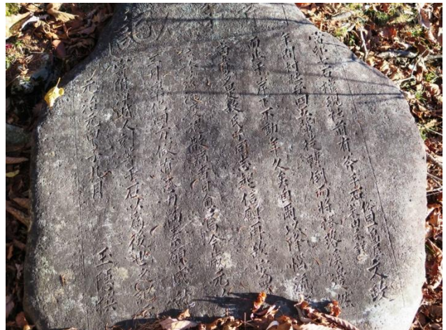
元治元年(1864)の謂れが書かれた斧手石記

山頂からは唐松が邪魔して、富士山は見え難いが雲取山の眺めは良い。少し下ると両脇に石灯籠がある祠があつた。地図に七ツ石神社とあつた。直ぐ下に斧手石があつて、脇に元治元年(1864)の謂れが書かれた斧手石記が置かれてあつた。