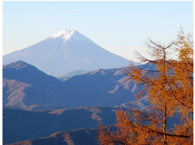
唐松の黄葉と富士山

ブナ坂まで来て、鴨沢に下る予定を変更し石尾根を奥多摩駅まで下ることにして七ツ石山へ登る。七ツ石山