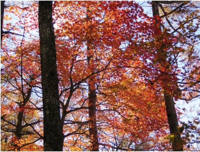
見事な紅葉に足が停まる

標識で鷹ノ巣山を通過したのを知る。尾根筋に出てしばらく歩く。単独の女性が大きなザックを背負い登って来た。快調に登って行く姿に見とれてしまった。やはり捲き道の方が歩き易いので、再び捲き道に入る。