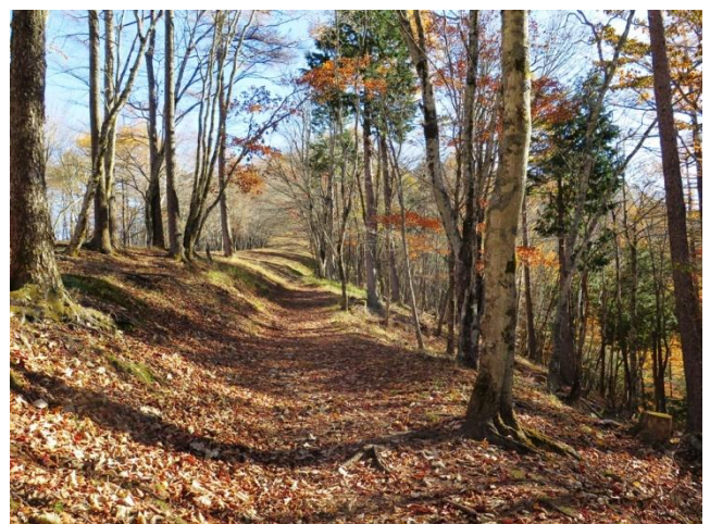
落葉が敷き詰められた石尾根縦走路