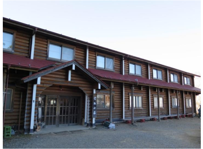
3時前に雲取山荘(1820m)に到着

5時朝食、5時半に雲取山荘を出発。東の空の水平線が朱に染まっている。着込んで来たので寒さを感じない。針葉樹林の登りだがキャップライトが要らない位で、日の出前に雲取山(2017m)山頂に着いた。