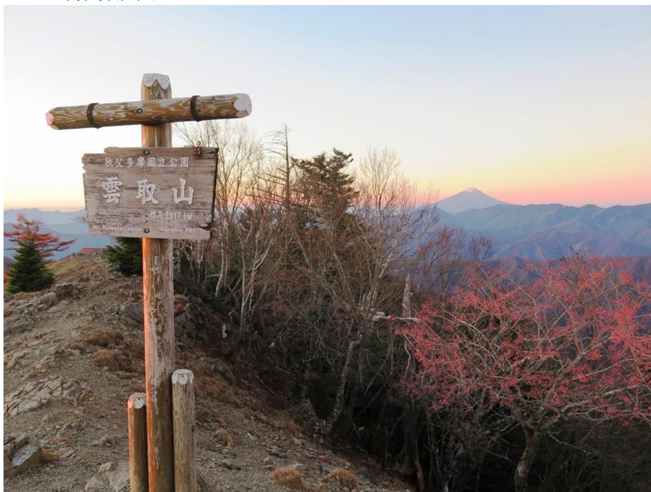
日の出を迎えた雲取山(2017m)山頂