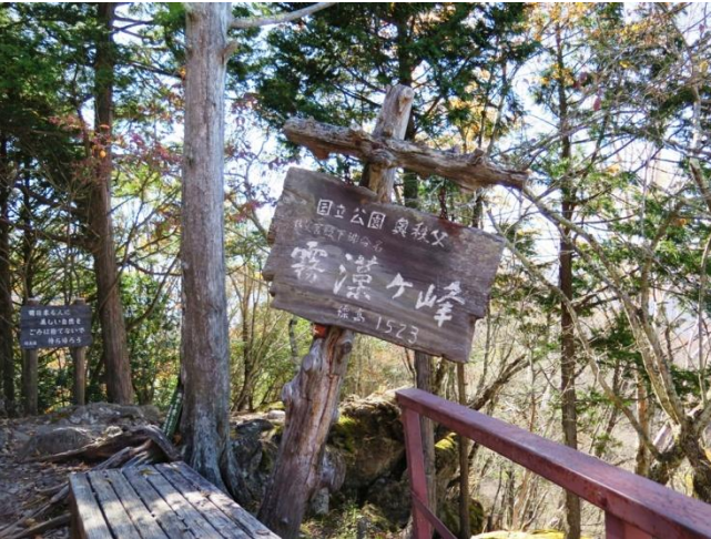
霧藻ヶ峰(1523m)休憩所前

ず、マナーが良いとは言えない。白岩小屋の前に出た。白岩小屋は廃屋になっている。トイレと前のベンチは使える。ここに着くまで、雲取山荘に到着