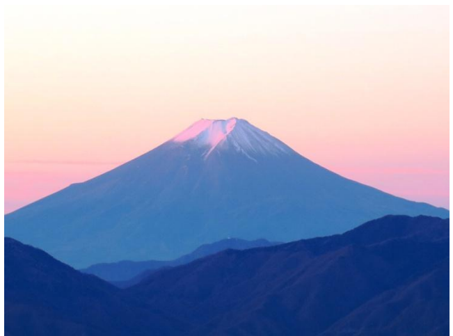
雲取山山頂から朝焼けの富士山