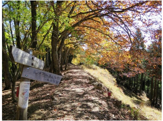
快適な石尾根縦走路

捲き道は、標識はあるが目印となる場所の表示が無いので、どの辺りを歩いているのか分かり難い。単独で奥多摩駅から登って来たと言う別の女性に時間を聞いてみたら、奥多摩駅を8時に出たと言う。時計を見ると10時を少し回ったところだ。どうやら12時前に奥多摩駅に着きそうだと分る。六ツ石山の山腹を歩いている時、突然ガサガサという音がしたので熊かと身構えたら、猿の一群が斜面を一目散に駆け下りて行く。少し行くともう一群が斜面を駆け下りて行った。鈴を鳴らして歩いていたので反応した様だ。脅かされた。杉・檜林を下って行くと登山口の林道に出た。長い縦走路だったが石尾根を下って来て良かった。