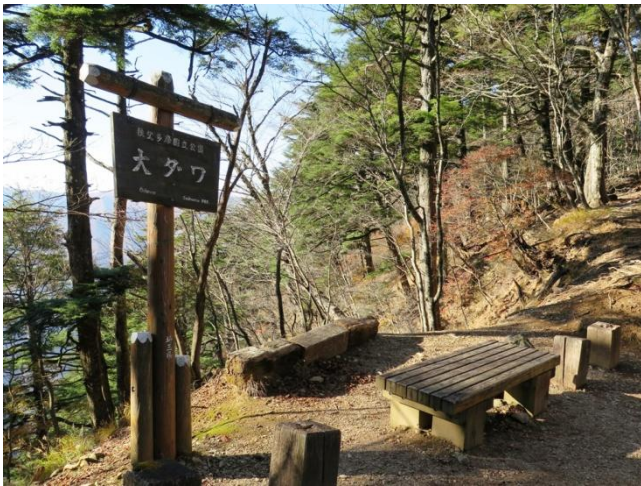
大ダワ(1700m)から男坂を登る

する時間が読めなかったが、15時には着きそうだと分りホッとし、ベンチで昼食にする。