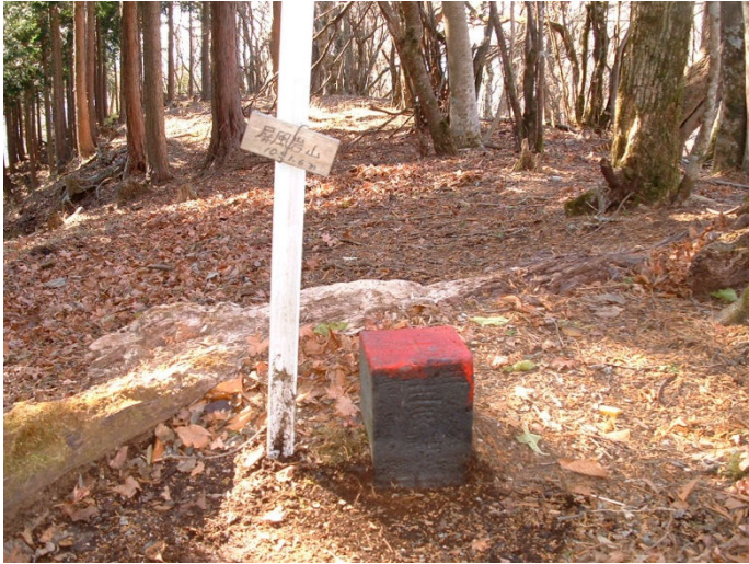
屏風岩山に 10 時 40 分到着