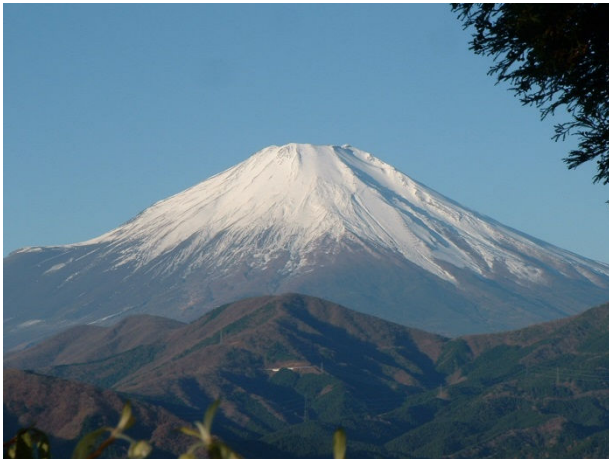
ミツバ岳からの富士山 お～！近い

ミツバ岳頂上周辺には、和紙の原料の一部になる、ミツマタが有り、三月に花が黄色になるらしいが、まだ白だった