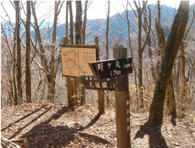
大滝峠上に 11 時 30 分に到着