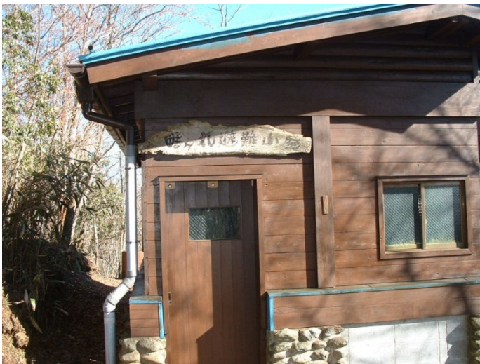
哇ヶ丸避難小屋に 12 時 30 分に到着 きれいに整頓されていました