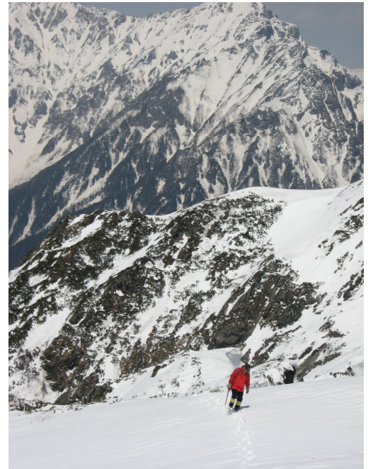
(もう直ぐ頂上へ・福沢君)