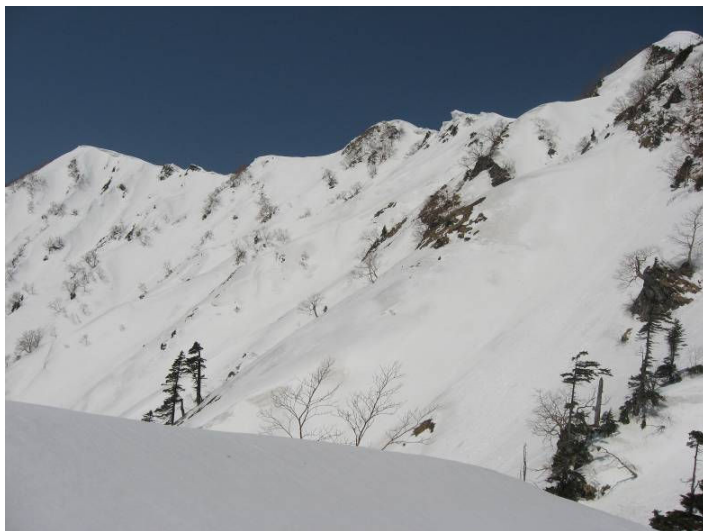
(コルからk1、k2、霞沢岳を望む)

下りも雪が腐ってきており、特にk1からの下りは後ろ向きとなって一步一步ステップを確認しながら慎重に下る。年のせいか行動が慎重にならざるを得ない。ロープをもっていればガンガン行きたいところだが。後はテント場までの長いトレースを登り返す。今日は、朝日に送られ、夕日に迎えられた長い1日でもあった。