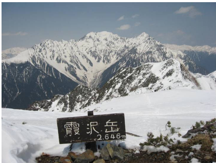
(霞沢岳からの穂高連峰)

今回の山行は、連休中全期間快晴になったのは8年ぶりとのことで、当会の北鎌尾根も十分に春山を堪能できたことだろう。