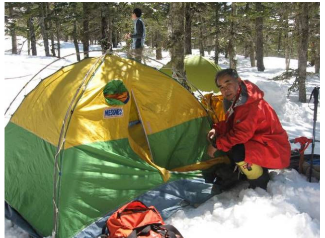
(ジャンクション樹林帯の中の宿泊地)