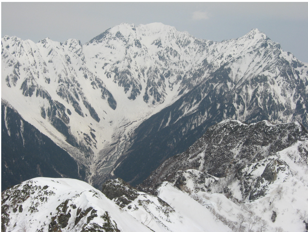
( K1・六百山を通して岳沢・奥穂高岳 )

今回の山行は、連休中全期間快晴になったのは8年ぶりとのことで、当会の北鎌尾根も十分に春山を堪能できたことだろう。