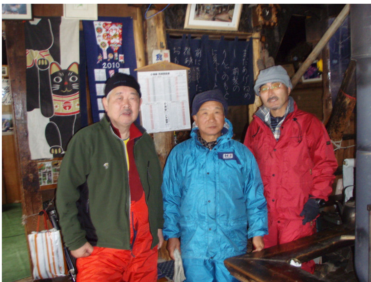
(高齢者登山家集団)