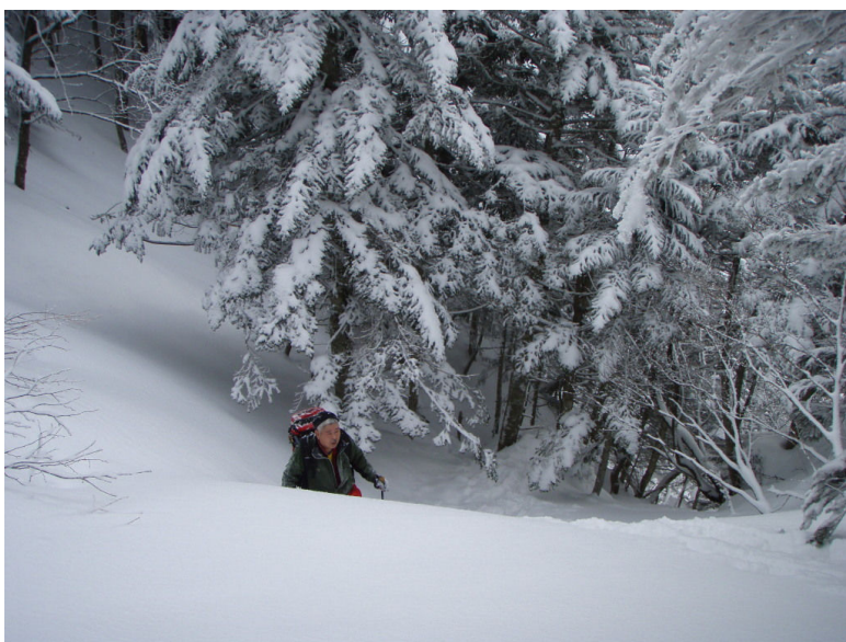
(中山峠直下雪を掻き分けて)

途中天狗岩からの下りが薄い雪で、安全を期して後ろ向きで下ったが彼ら二人は、そのまま下りたいものだ后感心する。樹林帯に逃げ込めば、後は来た道のトレースを辿りながら小屋へ