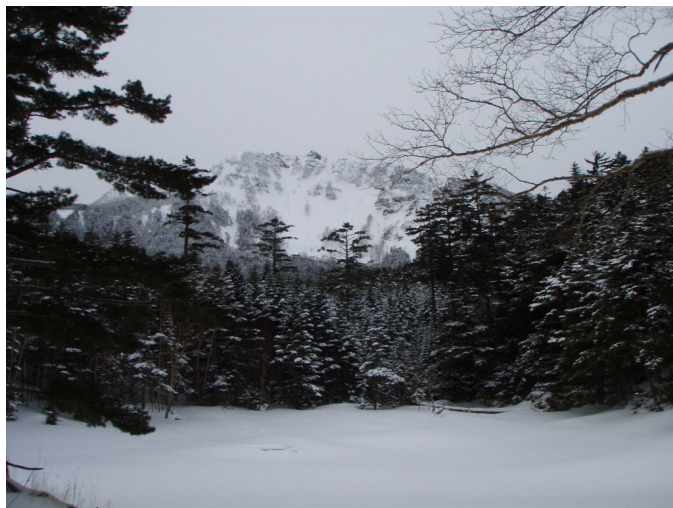
(みどり池からの天狗岳遠望)