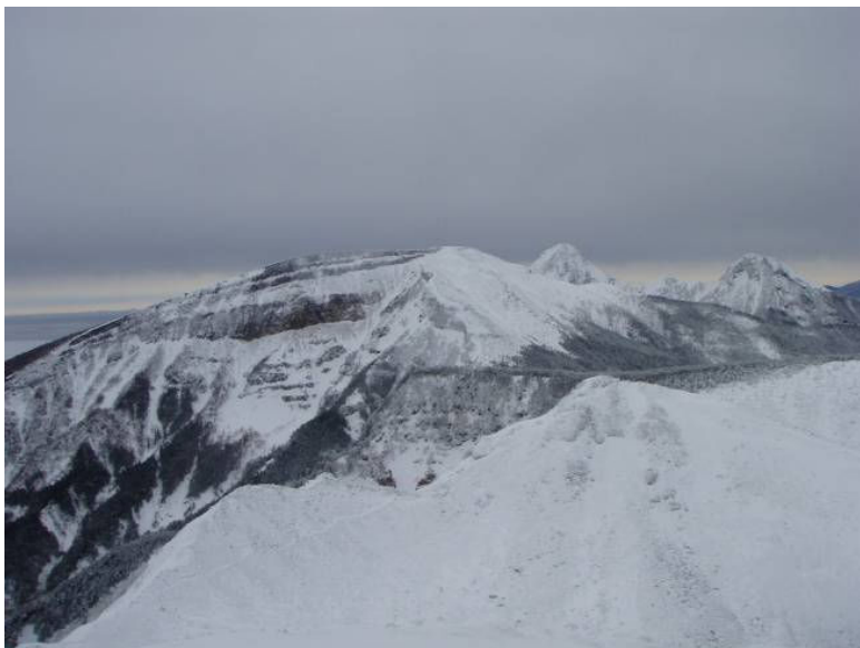
(硫黄岳爆裂口・赤岳・阿弥陀岳を望む)